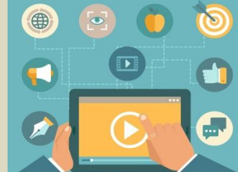
Programas de RRPP