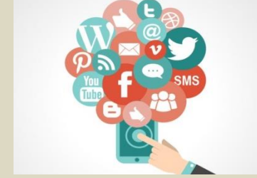
Relaciones en social media