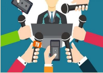
Gabinete de prensa