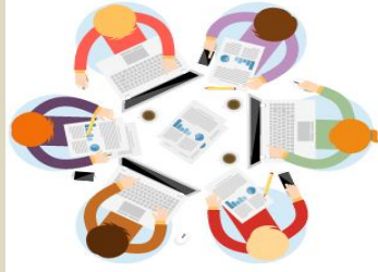
Organización de eventos